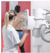
Une profession entre sciences, innovation et contacts humains