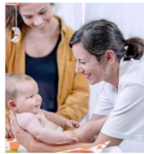
Une profession au cœur de la vie

Par Manahen BARILIER, Responsable infrastructures, logistique et durabilité HESAV