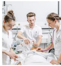
Une profession centrée sur la personne