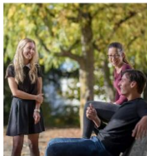
Votre porte d'entrée au Bachelor