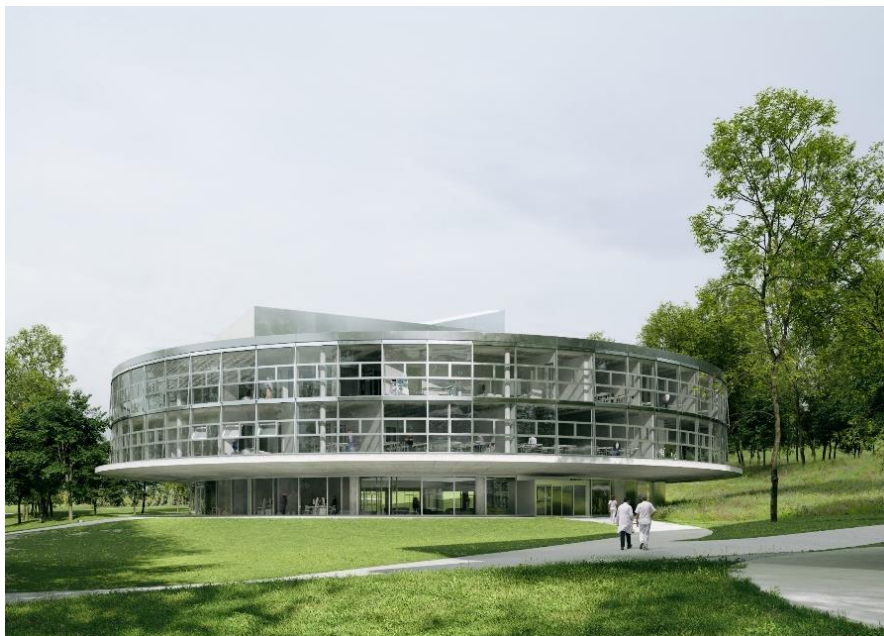
Image de synthèse : futur bâtiment C4, situé sur les Côtes de la Bourdonnette

La simulation constitue un atout pour les formations des professions de la santé et pour la sécurité des patients. La pratique de la simulation se développe fortement depuis quelques années au sein des Hautes écoles en charge de la formation dans ce domaine, au niveau international ainsi qu'au niveau national. Elle peut être définie, en suivant la Haute Autorité de Santé française, comme suit : « La simulation en santé correspond à l'utilisation d'un matériel, de la réalité virtuelle ou d'un patient standardisé, pour reproduire des situations ou des environnements de soins, pour enseigner des procédures diagnostiques et thérapeutiques, et permettre de répéter des processus, des concepts médicaux ou des prises de décision par un professionnel de santé ou une équipe de professionnels ». La pratique de la simulation peut se faire par l'usage de différents moyens, comme la simulation humaine (patient standardisé, jeux de rôle), les simulateurs procéduraux (bras de perfusion, etc.), les simulateurs patients (mannequins grandeur nature, avec différents niveaux possibles de technicité, etc.), les interfaces informatiques (serious game, réalité virtuelle, etc.). L'apprentissage clinique par simulation permet aux étudiants de développer une expérience pratique avant leur premier contact avec un patient.